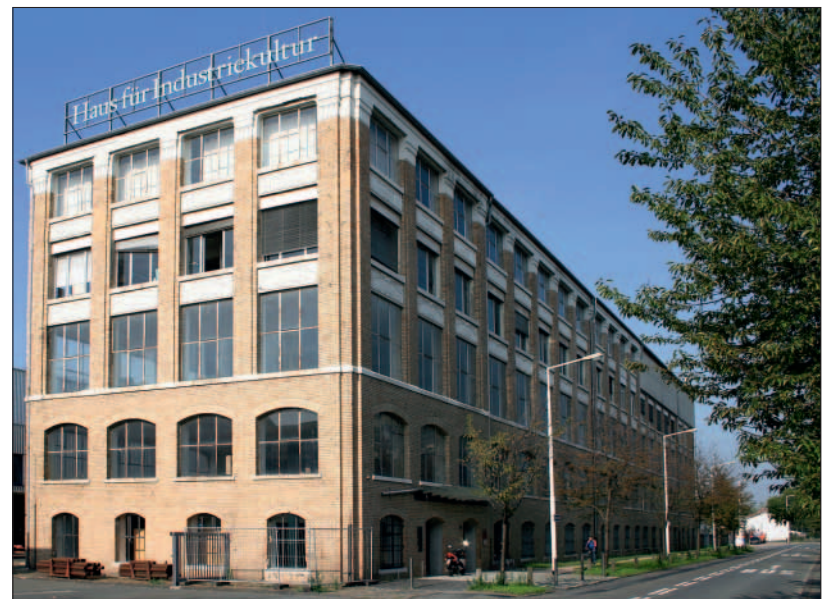
Imposant: Die Außenstelle des Hessischen Landesmuseums Darmstadt in der Kirschenallee 88 beherbergt die Abteilung Schriftguss, Satz und Druckverfahren.

Landgraf LUDEWIG I. seine Kunst- und Naturaliensammlung dem Land und machte sie der Öffentlichkeit zugänglich, darunter etwa das druckgraphische Werk DÜRERS und REMBRANDTS. Auf eine Initiative von Großherzog ERNST LUDWIG geht der 1906 einge-